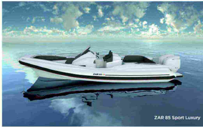
ZAR 85 Sport Luxury

Ancora novità con il Valiant 750 Raptor di Brunswick Marine, un battello pneumatico a chiglia rigida funzionale e sicuro, in grado di soddisfare tutte le esigenze di navigazione. I Cantieri Capelli presentano un nuovo modello da 12 mt che va a completare la gamma "Top Line": il Tempest 40, che rappresenta la naturale evoluzione dell'ormai conosciuto e blasonato Tempest 1000 WA.