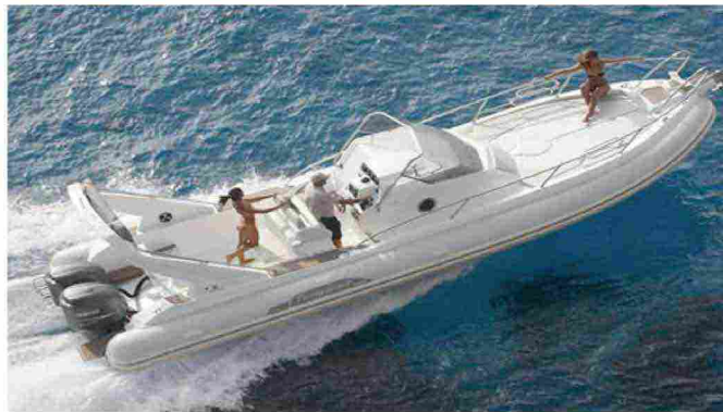
Tempest 1000 WA

Ha una lunghezza fuoritutto di otto metri e trentacinque centimetri il nuovo Marlin 274 del cantiere Marlin Boat con carena a V profonda studiata per affrontare qualsiasi condizione di mare e garantire il massimo confort. I passeggeri possono usufruire di un'ampia area a poppa rapidamente convertibile da prendisole a dinette a U, con tavolo che accoglie comodamente sei persone.