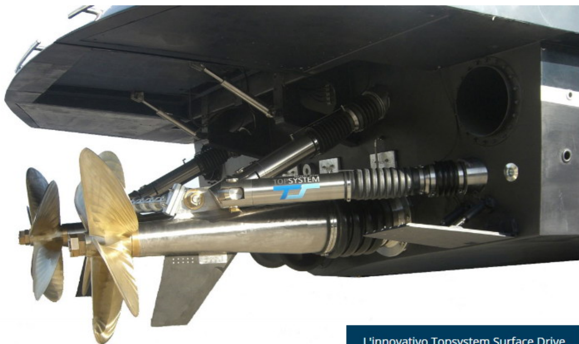
L'innovativo Topsystem Surface Drive

© 16 AGOSTO 2016 COMMENTI (0) CANNES YACHTING FESTIVAL, NEWS, ULTIMA ORA