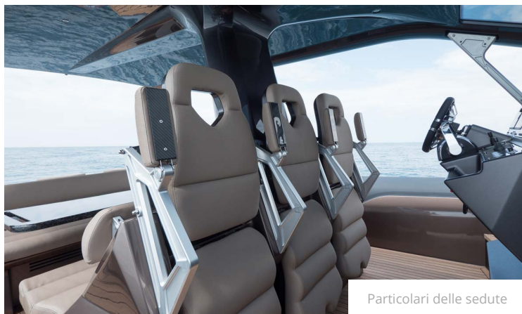
Particolari delle sedute

🕒 25 LUGLIO 2018 💬 COMMENTS (0) 📁 CANNES YACHTING FESTIVAL, CANTIERI, GOMMONI, NEWS, SENZA CATEGORIA